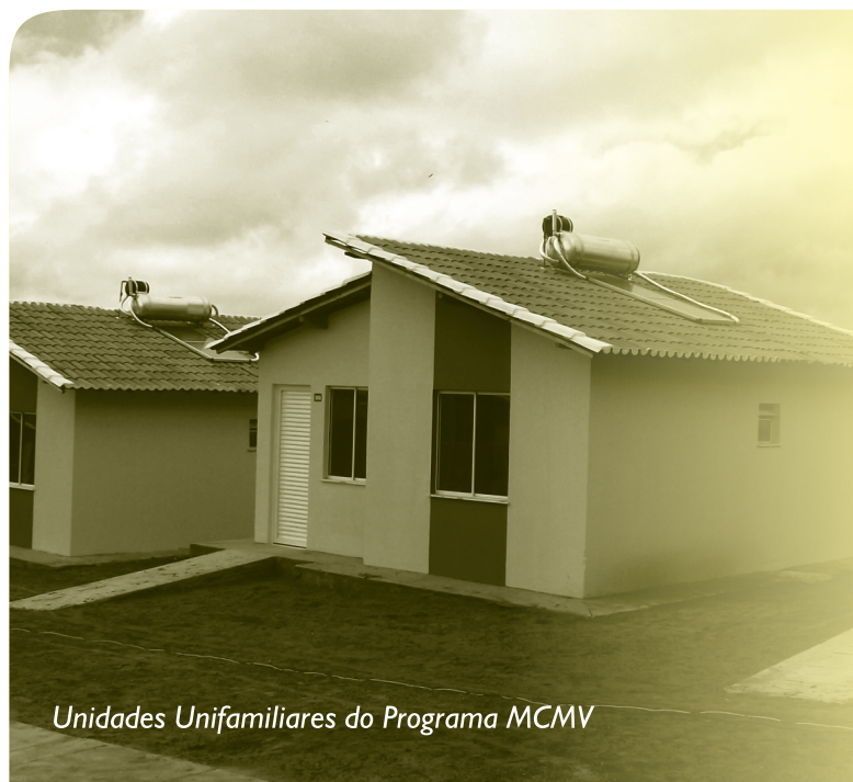
Unidades Unifamiliares do Programa MCMV

Soletrol Indústria e Comércio Ltda. Rodovia Marechal Rondon, Km 274 São Manuel - SP - CP 53 - CEP 18650-970 informativo@soletrol.com.br